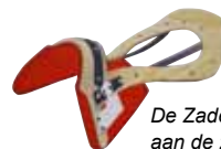
De Zadelwing vastgezet aan de zadelboom